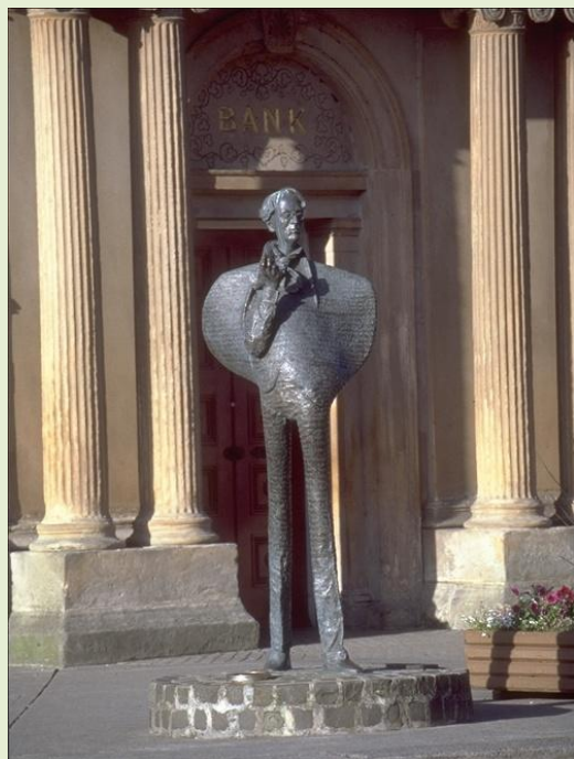
Alle Rechte vorbehalten.

Die vom Hawk's Well Theatre in Sligo organisierte 6. iYeats Poetry Competition (Lyrikwettbewerb) nimmt noch bis Mittwoch, 9. Juli 2014 Bewerbungen an.